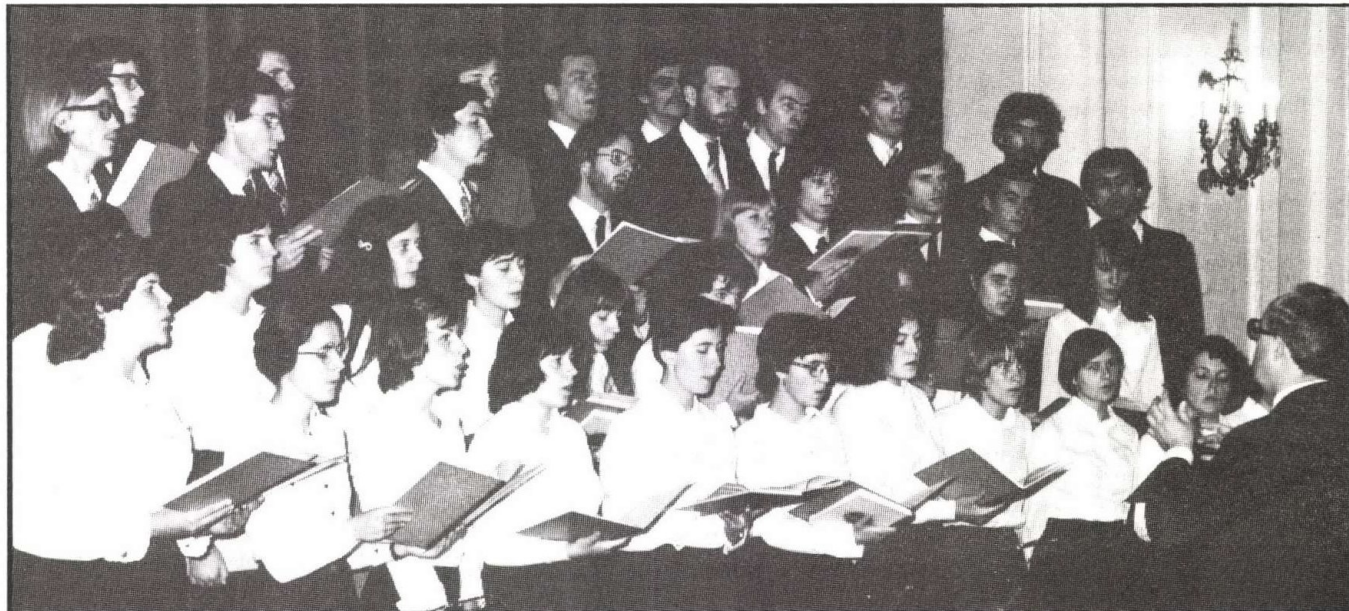
Zeneiskolai kórusával, 1970 körül

Én aztán teljes erővel a protestáns passiók történetét dolgoztam fel. Ez azt jelentette, hogy nemcsak Magyarországon kellett összegyűjteni a forrásokat, hanem bejártam szó szerint egész Európát: Olaszországot, Svájcot, Ausztriát, Franciaországot, Hollandiát, Belgiumot, Svédországot, Németországot, és