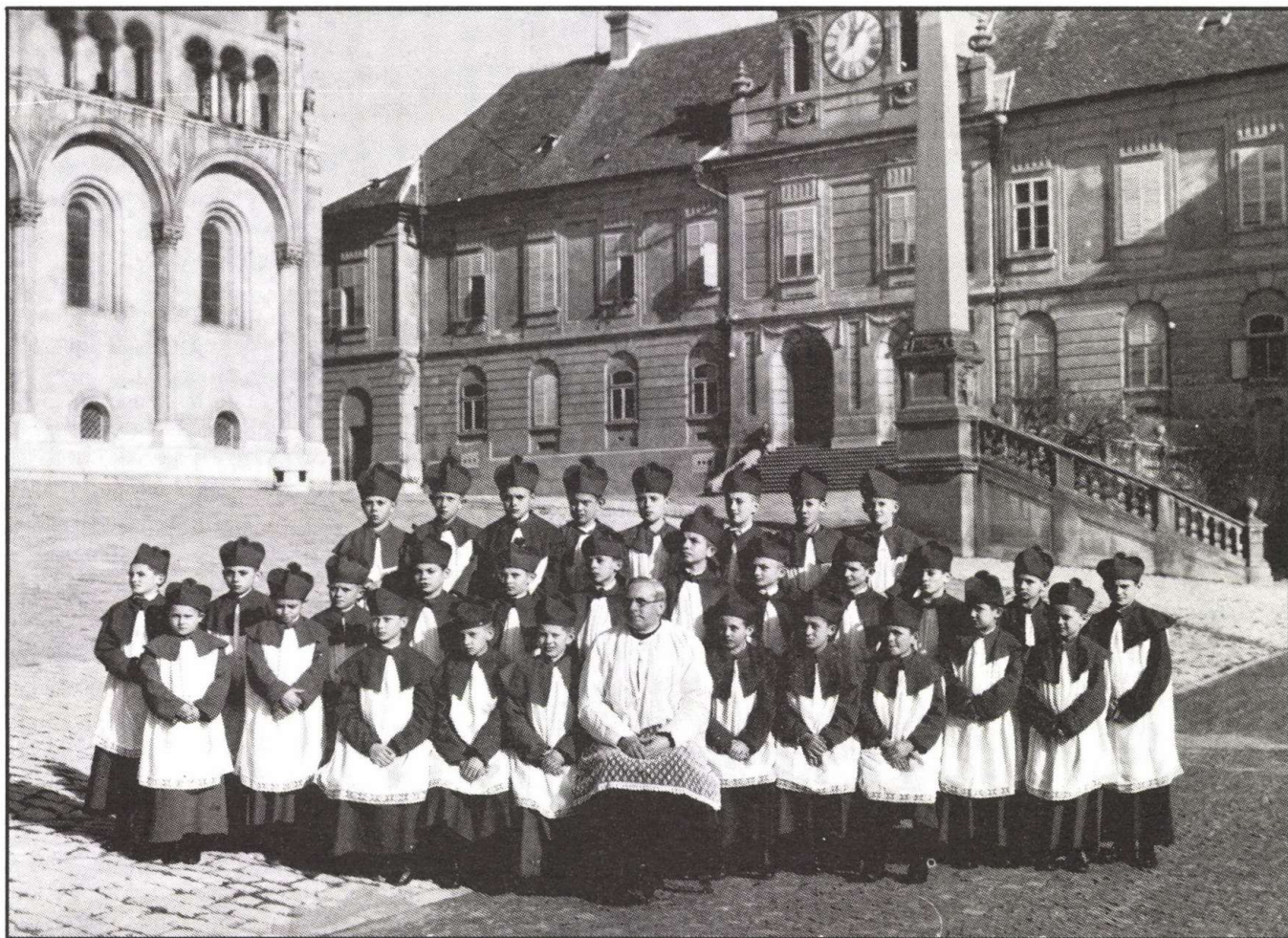
A pécsi Énekes Iskola növendékeként a felső sor közepén (1930-as évek)

Bennünket gépiesen áttettek a középiskolai énektanár- és karvezető-képzőbe, így Ádám Jenő, Gárdonyi Zoltán, Gát József, Vásárhelyi Zoltán is tanárunk volt; Kodály persze már azelőtt is, mert hiszen népzenét nála hallgattunk. A mi évfolyamunk 1949/50-ben hallgathatta még az egyházzenei tárgyakat; így a végén mi nemcsak középiskolai ének- és zenetanári oklevelet kaptunk, de az Egyházmegye Esztergomban az index alapján kiadta nekünk az egyházkamagyi diplomát is.