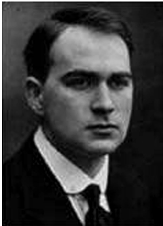
1. kép. Jemnitz Sándor (1890–1963)

csak ritkán fűzte lelki összhang. Élete jelentős részét a négy fal között – nagyrészt írással, olvasással és komponálással – töltötte. Magányában naplói jelentették az állandó társat, a legfőbb bizalmast, „akit” olykor megszemélyesített: egy-egy füzetet megkezdve üdvözölte az elkövetkezendő hónapok kísérőjét, a napló végére érve pedig elbúcsúzott a teleírt lapoktól. Bejegyzéseit tanulmányozván az az olvasó érzése, hogy Jemnitz számára terápiaaként szolgált a naplóírás. Naplójának – mint egy legbensőbb barátjának – minden érzéséről őszintén beszámolhatott, annak veszélye nélkül, hogy az visszaél a közölt információval.