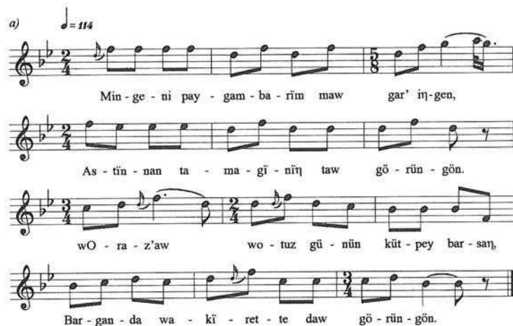
28. kotta. Mongóliai kazak kvart-kvintváltás

Mint láttuk, a mongóliai kazak dallamokra nem jellemző a határozott kvart-, illetve kvintváltó szerkezet. Egyes esetekben azonban mégis hallhatunk ilyen jellegű sorpárhuzamokat, de ezek ebben a népzeneben nem alkotnak külön dallamcsoportot (28. kotta).