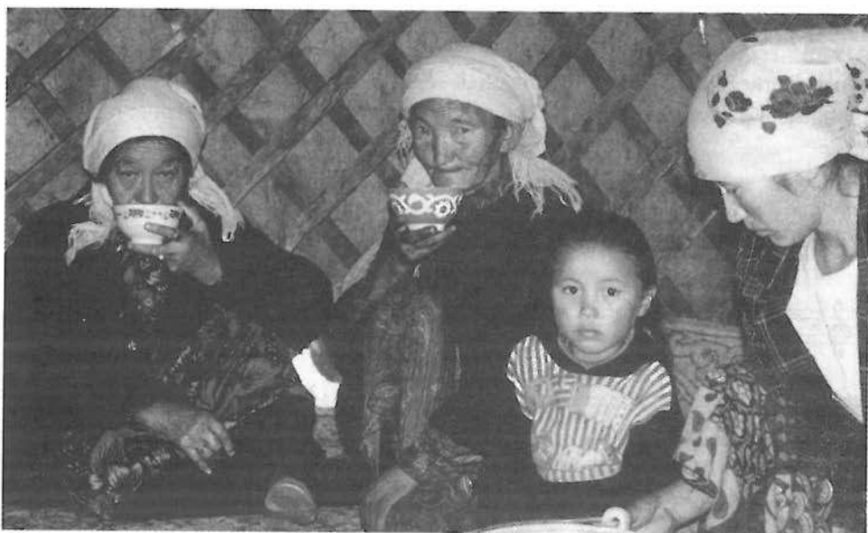
2. kép. A kazak asszonyok békésen teázgatnak