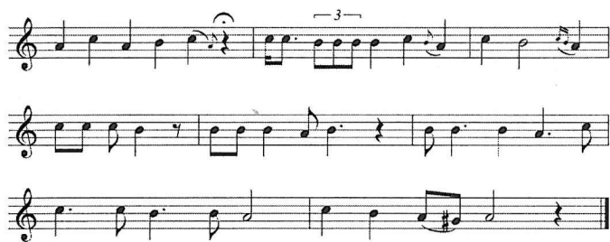
Ex. 6 Énekes lezárás

17. A mugam ciklus végén egy szenvedélyes lezárás van, melyben az énekes egy oktávval magasabbra emelkedve gyönyörű díszítésbokrokkal, de csak néhány hangot használva zárja a szvitet. Ennek dallamvázlatát látjuk ex.6-ban.