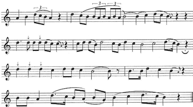
Ex.5 Szegah dallam – népzenei kapcsolatok

Talán ez a rész mutatja leghatározottabban a népzene és a mugam összefüggését. Hangsora az azerbajdzsáni népzene legjellegzetesebb skálája a szegah ( la-szo-fa-mi-re-do-ti ). Azonban a népi dallamok ennek a skálának alapvetően csak az alsó három-négy hangját használják, míg a mugam előadásban a zenekar és az énekes jóval magasabb regiszterekbe is ellátogat. Mégis minden pillanatban pontosan lehet érezni a népzenei alapot.