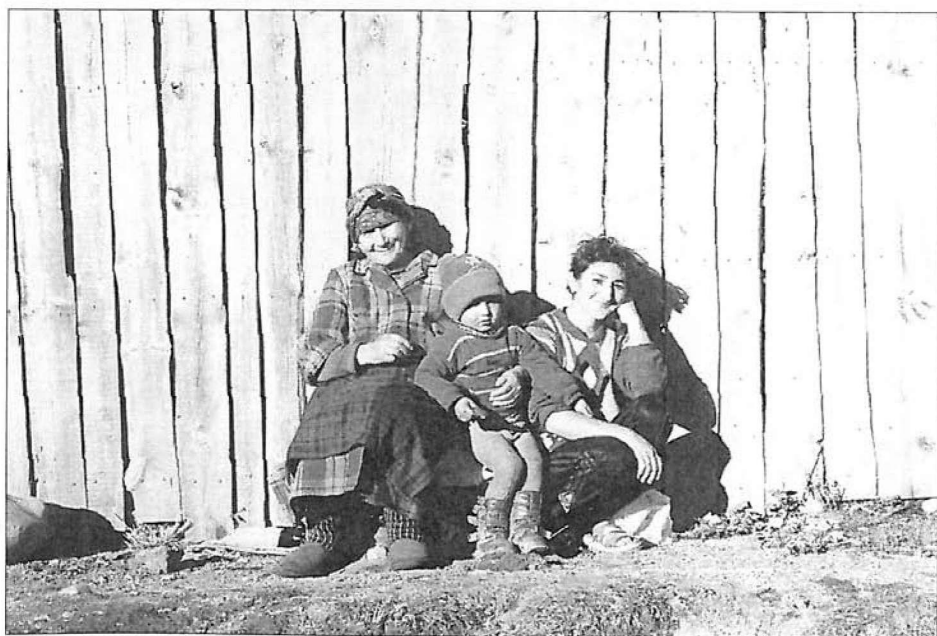
Három generáció Balkárföldön

Mint láttuk, a karacsáj és magyar gyermekdalok között a tágabb stílusazonosság mellett csak távolabbi, általános hasonlóságok voltak felfedezhetők. A karacsáj–balkár pszalmódizáló és sirató dallamok azonban ugyanabba a bartóki ős „stílus-faj”-ba tartoznak, mint a magyar, anatóliai, sőt a bulgár, szlovák és egyes más népek megfelelő dallamai. 18 Noha az általánosabb stílusazonosság alatt jellegzetes etnikai, illetve areális különbségek mutatkoznak, az egyedi jelenségek hasonlósága, a dallamformálás mégis megengedik a tágabban értelmezett közös eredetre, de legalábbis a szorosabb zenei rokonságra vonatkozó kutatások folytatását.