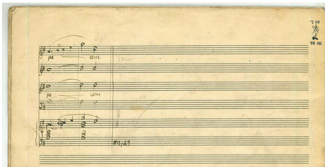
1/b kottapélda. Kósa: 2. mise – Agnus Dei. A kézirat utolsó oldala a mű elején megismert kétütemes motívummal, „pacem” szöveggel.