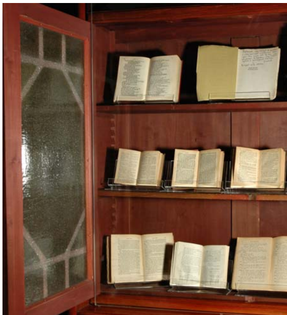
Bartók könyvtárából

kapcsolat kezdettől jellemezte az archívum munkáját (hangfelvételek szövegkritikai előkészítése, az 1960–70-es évekbeli Hungaroton lemezösszkiadás szerkesztése stb.). Bár formálisan nincs kapcsolatban a felsőoktatással, egyedülálló anyaga és munkatársainak szakértelme révén a Bartók Archívum a zenetudományi oktatás és posztgraduális képzés egyik magyarországi bázisa, hazai és külföldi PhD disszertációk életre segítője. Ujabban Bartók zeneszerzői módszerének tanulmányozása és komplex kutatási projektek állnak az intézeti munka középpontjában: Bartók zeneműveinek kritikai összkiadása mintakötetei és a Bartók tematikus műjegyzék .