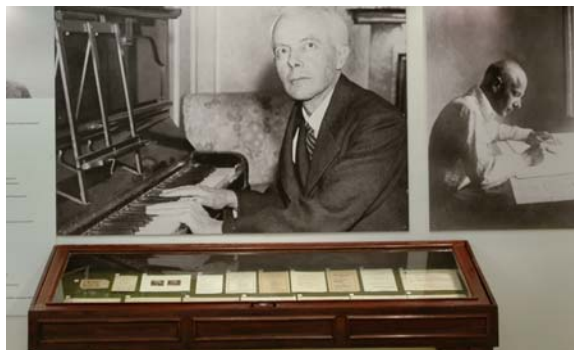
4. vitrin

2006. március 22. és 24. között nemzetközi zenetudományi konferencia zajlott a Zenetudományi Intézetben „Bartók's Orbit” címmel. Ehhez kapcsolódva került megrendezésre a kiállítás, melynek előzetes zártkörű megnyitójára az esemény résztvevőinek jelenlétében került sor.